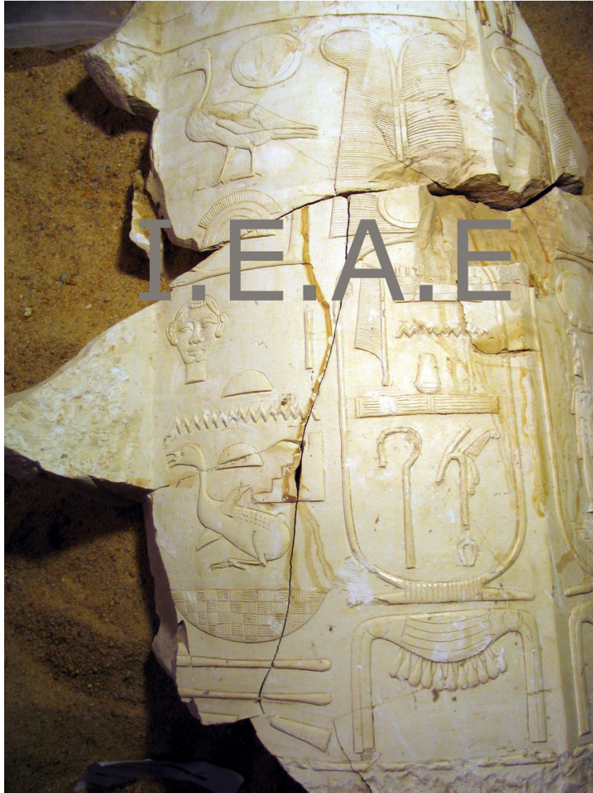
Fragmento de columna con el nombre de Amen-Hotep III. Dinastía XVIII (1358-1355 B. C.)

Proviene: Tumba del Visir Amen-Hotep Huy -nº-28- at Asasif (Luxor). Descubierto por la Misión Arqueológica Española Proyecto Visir Amen- Hotep Huy del Instituto de Estudios del Antiguo Egipto de Madrid. España.